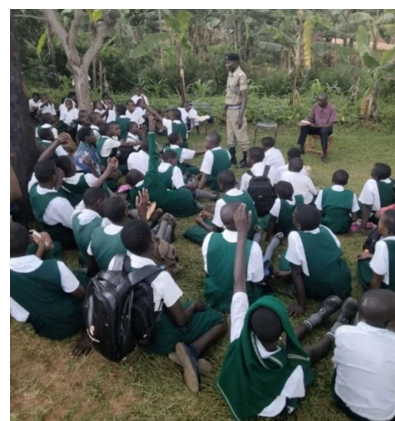
Kinder besuchen die Polizeistation Ngogwe während eines Ausflugs.