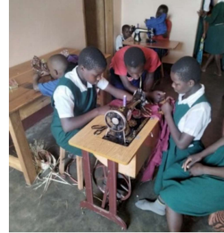
Kinder nähen Damenbinden.