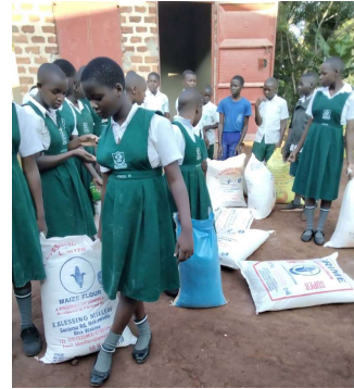
Verteilung der gekauften Lebensmittel an die Familien unserer Schüler*innen.

in die Höhe treiben. Auch die Kosten für Lebensmittel für die Schule sind gestiegen: Der Preis für einen 50 kg Sack Mais - diese Menge benötigt die Schule täglich zur Versorgung der Kinder - hat sich fast verdoppelt, er ist von 92.000 UGX (23,87 €) auf 166.700 UGX (43,34 €) gestiegen. Die Erträge aus dem Schulgarten helfen, diese Kosten zu reduzieren. Die Schule hat 30 Prozent ihrer Lebensmittel im Schulgarten selbst produziert, hauptsächlich Mais, Süßkartoffeln, Maniok, Milch, Gemüse, Früchte wie Avocados und Kochbananen. Wir danken auch der GLS Zukunftsstiftung Entwicklung für die direkte Unterstützung der Lebensmittelversorgung.