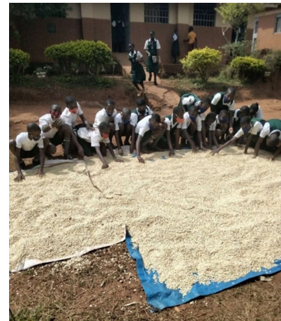
Mais, aus dem Schulgarten geerntet