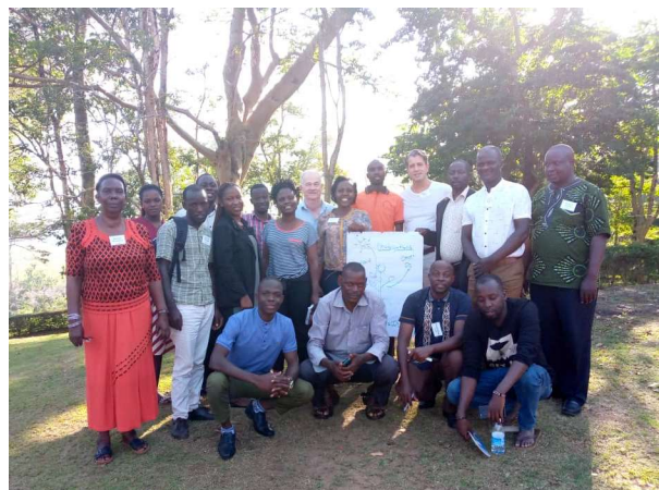
Die Klimawandelgruppe während der Weiterbildung

Im August 2022 nahmen fünf Lehrer*innen der Kisakye Schule am „All Africa Anthroposophic Training (AAAT)“ (Weiterbildung in Anthroposophie für den afrikanischen Kontinent) teil, das vom „Green Light Forum“ veranstaltet wurde, einer Arbeitsgemeinschaft, der die Kisakye Schule angehört. Die Lehrer*innen lernten etwas über die frühkindliche Entwicklung, die Landwirtschaft, den Klimawandel und die Betreuung schwangerer Mütter mit Kindern. Dies verbesserte nicht nur ihr Verständnis für die Umwelt, sondern auch für ihr eigenes Privatleben. Wir danken der GLS Zukunftsstiftung Entwicklung für die Unterstützung des Workshops.