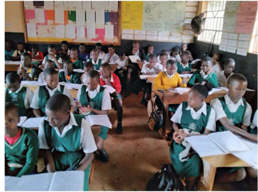
Schüler*innen der Klasse fünf im Unterricht