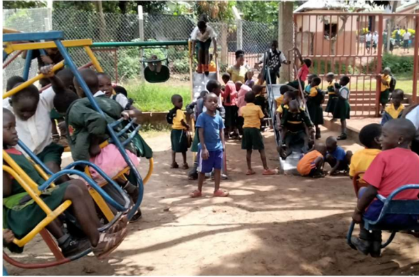
Kinder auf dem Schulspielplatz