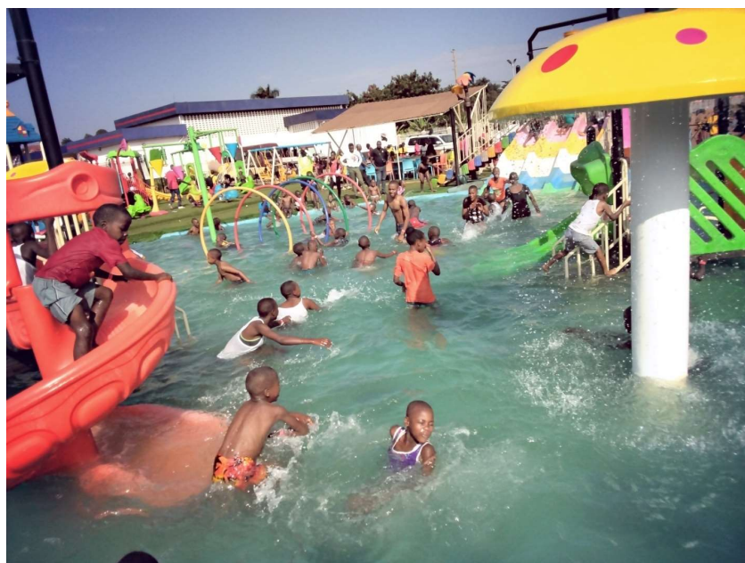
Kinder haben Spaß beim Schwimmen im Kids' Park.