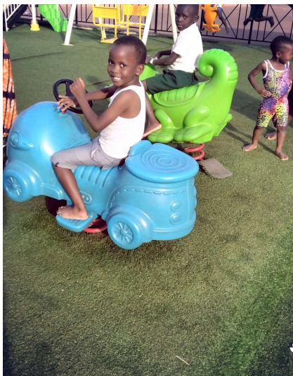
Links: Kindergartenkinder im Kinderpark