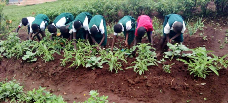
Kinder dünne die Gemüsepflanzen aus und machen den Boden um sie herum lockerer, zur besseren Bewässerung und Belüftung.