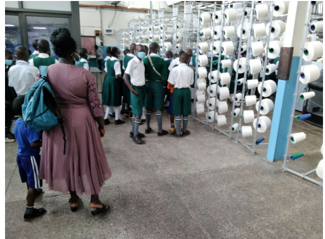
Ein Besuch bei Nyanza Textil Industries