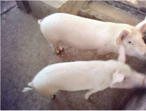
Zwei unserer Ferkel

Insgesamt sieben Mitarbeitende, die sich für die Schweinezucht interessierten, erhielten eine Starthilfe in Form eines Schweins und Futtermitteln.