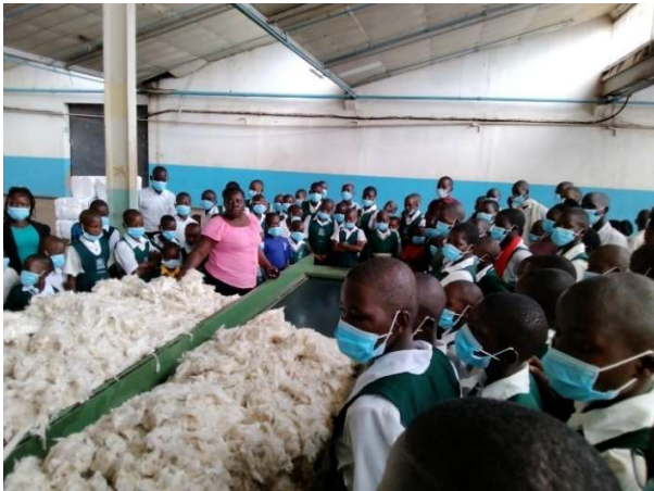
Kinder, die in der Herstellung von Baumwollstoffen geschult werden.

Die Schüler*innen machten viele Lernerfahrungen, da diese Orte für sie neu waren, und sie beendeten den Tag mit Schwimmen und Spaß im Kinder-Park.