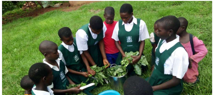
Kinder der fünften Klasse lernen, wie man das Gemüse schneidet, um es zum Kochen verwenden zu können.