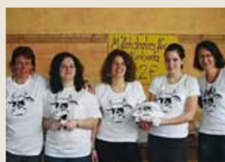
Milch für die Kinder von Nambeta – einige Akteurinnen im Kuhdesign

Eine Spendenaktion hatten sich Schüler/innen des Hölderlin-Gymnasiums in Heidelberg ausgedacht: Um der kleinen ugandischen Landschule Nambeta die Anschaffung von zwei Kühen zu ermöglichen, verkauften die Schüler/innen des „Seminarurses Afrika“ frische Milchshakes und selbstdesignte T-Shirts mit Kuhmotiv. Schüler der neunten Klasse spendeten den Erlös ihres Cafébetriebes am Tag der offenen Tür. Insgesamt 981,34 Euro kamen zusammen. Die Spende konnten wir verdoppeln. Dank dieses Engagements kann die Schulspeisung an der Nambeta-Schule bald durch Kuhmilch ergänzt werden. Zusätzlich gibt es Dung für den Kompost im Schulgarten. DANKE!