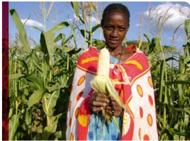
Mais für das traditionelle Gericht Ugali

Schließlich kamen beide gemeinsam zu dem Schluss, dass Wasser der wichtigste Faktor sein würde, um erfolgreich organischen Landbau zu betreiben. Deshalb reparierten sie zunächst den 500 l großen Tank, den sie zu Hause besaßen. Zeitgleich erhielt die Frauengruppe eine Erstausrüstung an landwirtschaftlichem Gerät und Baumaterialien für einen