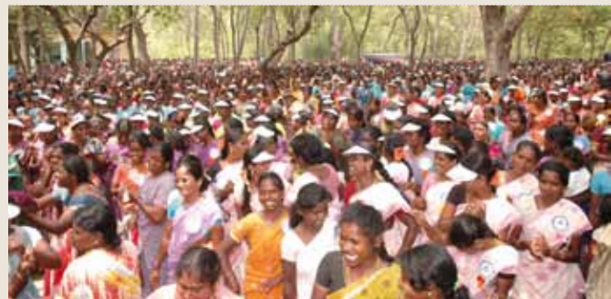
Ein buntes, fröhliches und Kraft spendendes Fest der Frauengruppen

Unser Projektpartner WARM feierte mit 20.000 Frauen, die sich in den letzten zehn Jahren zu Selbsthilfegruppen zusammenschlossen, ein großes Fest erreichter Frauenrechte – massiv, eindrucksvoll und fröhlich.