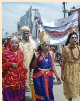
Götter fordern Respekt für Senioren.

Spendenzweck: Energiestationen für Afghanistan