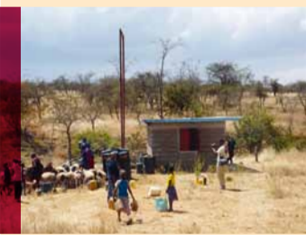
Das Pumpenhaus in Marandawua

Olemilebo – „Ort ohne Wasser“ hieß das Gebiet. Das nächste Bohrloch lag ca. zwölf Kilometer entfernt. 3.000 Menschen, 1.700 Rinder, 3.200 Ziegen und Schafe, 2.000 Esel waren von diesem Bohrloch abhängig. Unterstützt von der kenianischen Regierung suchten die vor Ort lebenden Massai nach Wasser, um den Andrang auf das Bohrloch zu mindern. In Olemilebo wurden sie fündig. Es wurde gebohrt, das Wasser war von guter Qualität. Aber das Bohrloch musste geschlossen werden. Es fehlte an Geld, um eine Pumpe, einen Wassertank und Becken für Menschen und Tiere zu bauen. Dank dreier Großspender fördert nun eine Dieselpumpe das Wasser, eine 1,7 km lange Wasserleitung wurde gebaut. Sie mündet in einen Wassertank, der zurzeit fertiggestellt wird. Nun müssen die Massai von Olemilebo nicht mehr so weit wandern, um Wasser zu bekommen. Und: Olemilebo wurde umbenannt in „Marandawua – Gesegneter Ort“.