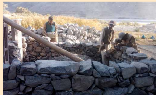
Der Winter naht: Hausbau mit lokal verfügbaren Materialien in Karakorum

Der Großteil der Spenden war für die Menschen in Pakistan bestimmt, insgesamt 50.957,77 €. Mit 10.000 € wurden im Rahmen der Soforthilfe Lebensmittel und dringend benötigte Medikamente gekauft. Die übrigen Mittel werden für den Wiederaufbau eingesetzt: Viele Menschen haben ihre Häuser verloren. So werden Häuser in einem Dorf in Karakorum, einer abgelegenen Region im Norden Pakistans, gebaut. Pro Haus werden ca. 1.200 € benötigt. Über die weitere Entwicklung werden wir Ihnen berichten.