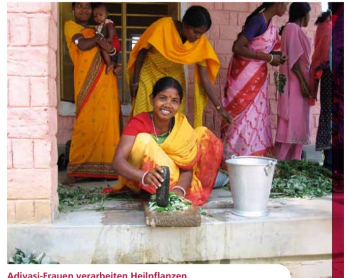
Adivasi-Frauen verarbeiten Heilpflanzen.

Die Kosten für Roh- und Innenausbau der Kinderstation (75.000 €) sind durch Spenden bereits weitgehend gedeckt, es fehlen noch ca. 10.000 € für medizinisches Gerät wie Sauerstoffkonzentratoren, Absauggerät, EKG, Pulsoximeter und Infusionsgeräte. Die Geräte werden in Indien gekauft. Monika Golembiewski rechnet mit ca. 660 Kinderpatienten pro Jahr. Pro Kind sind dies Anschaffungskosten von 15 €.