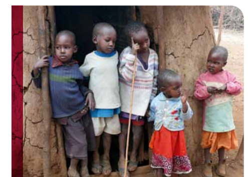
Ein Kindergarten – Bildungschancen für die Kinder in Selenkay