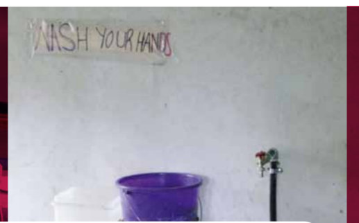
Wash your hands: Zurzeit läuft diese Aufforderung ins Leere, denn ohne Zertifizierung dürfen keine Früchte verarbeitet werden.