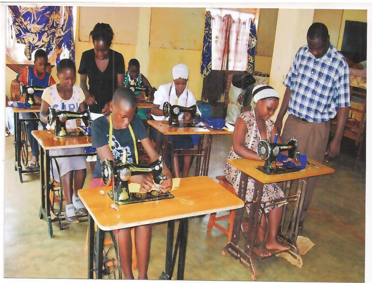
Secondary Schülerinnen, die während der Ferien den Nähunterricht besuchen.

Seit sechs Jahren gibt es nun das Programm für die weiterführende Schule. 20 Kinder werden gefördert. Es ist eine Ausdehnung des Patenschaftsprogrammes, in dem einige unserer bedürftigen Patenkinder an einer weiterführenden Schule ihrer Wahl weiter gefördert werden. Jedoch sind viele von ihnen bei den berufsfördernden Aktivitäten während der Ferien mit uns zusammen, in dieser Zeit entwickeln sie ihr praktischen Fähigkeiten weiter, wie Nähen, Kochen, Gartenbau und Holzarbeiten.